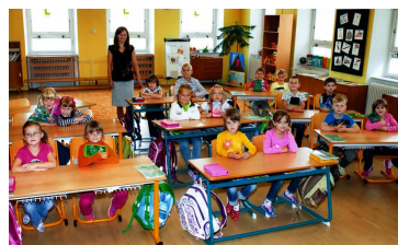
Můj první školní rok, 2012 - 2013

Skoro první dva měsíce mají úspěšně za sebou naši prvňáčci. V prvních dnech se seznámili s novými spolužáky a paní učitelkou a pak už přišli na řadu první písmenka a čísla. Všichni společně cestují od jedné písmenkové země k druhé. V každé zemi poznávají něco nového, takže je za nimi, už za tak krátkou dobu, vidět spousta práce. Všechny prvňáčky chválíme a přejeme jim hodně úspěchů při další práci.