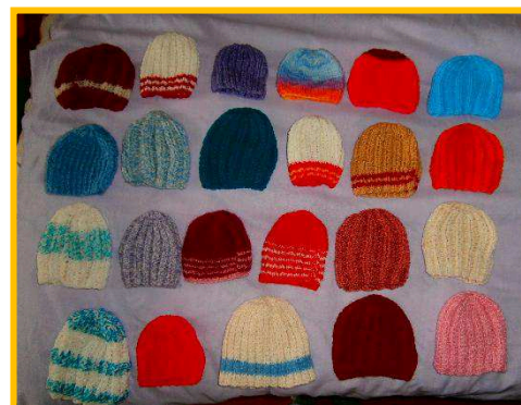
Bc. Čermínová Lucie